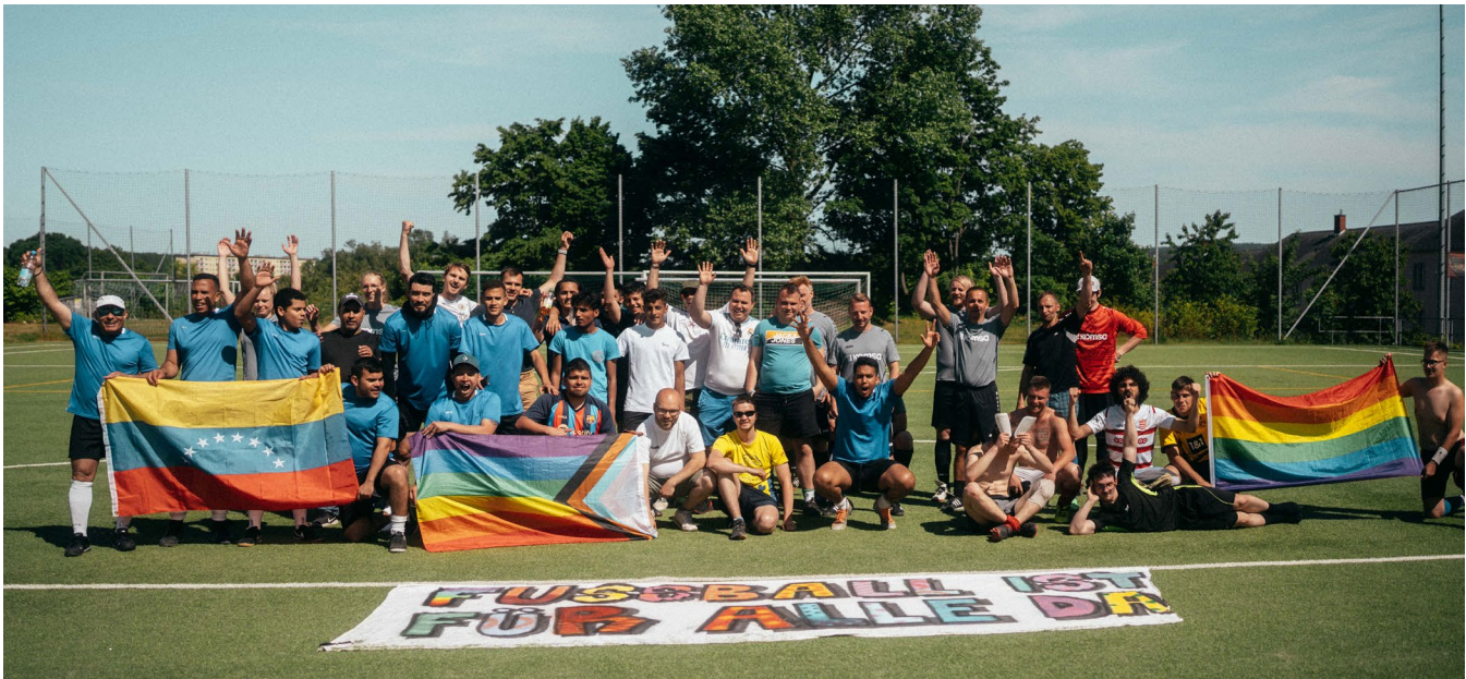
Projekt „Heimspiel“

Sie gemeinsam im Team, ob es nicht manchmal auch sinnvoll sein kann, Angriffe, die öffentlich nicht wahrnehmbar sind, zu ignorieren. Wenn Sie unsicher sind im Umgang mit der Presse oder nicht wissen, ob Öffentlichkeit in Ihrem konkreten Fall sinnvoll ist, lassen Sie sich beraten.