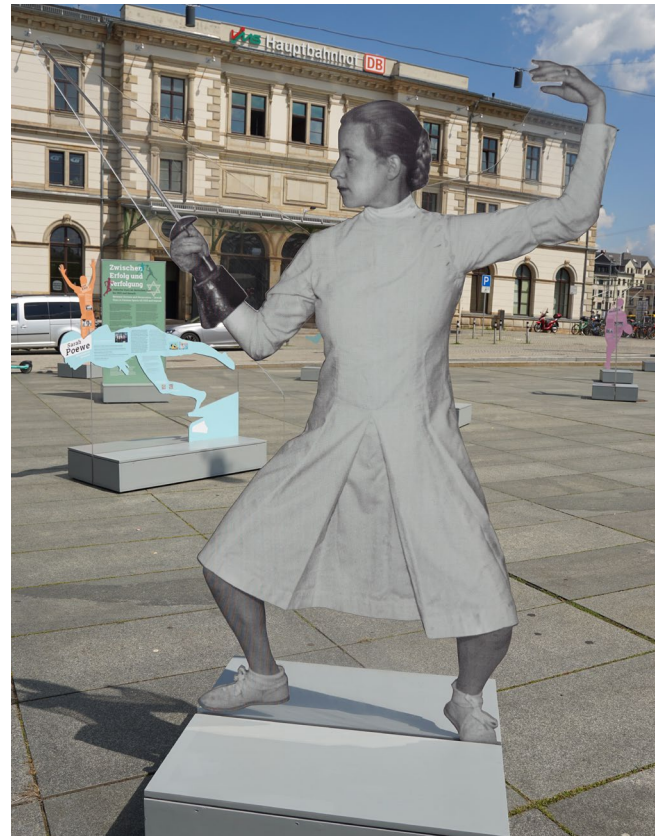
Ausstellung „Zwischen Erfolg und Verfolgung“ auf dem Chemnitzer Hauptbahnhofsvorplatz

Im Zuge der Veröffentlichungen des Correctiv-Magazins zum Geheimgespräch extrem rechter Akteur*innen Ende 2023 in Potsdam kam es jeweils in Plauen und Zwickau zu Demonstrationen gegen menschenfeindliche Positionen und für Demokratie. Das Theater Plauen-Zwickau unterstützte die Demonstrationen, indem es dazu aufrief, sich an den Protesten zu beteiligen. Die Demonstrationen wurden von einer großen